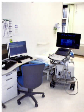
心臓・血管エコー室